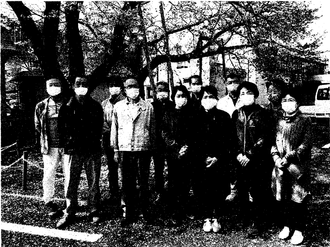
(令和3年3月31日 「母校の桜」の下で：企画調整保護司)